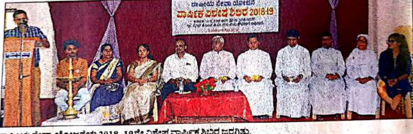
ರಾಷ್ಟೀಯ ಸೇವಾ ಯೋಜನೆಯ 2018-19ನೇ ವಿಶೇಷ ವಾರ್ಷಿಕ ಶಿಬಿರ ಜರಗಿತು.

ನಂತೂರು, ಜ. 2: ವಿಜ್ಞಾನ ಮತ್ತು ವೈಜ್ಞಾನಿಕ ಮನೋಧರ್ಮಕ್ಕಾಗಿ ಯುವ ಜನತೆ ಎಂಬ ಧ್ಯೇಯ ವಾಕ್ಯದೊಂದಿಗೆ ಪಾದುವಾ ಕಾಲೇಜ್ ಆಫ್ ಕಾಮರ್ಸ್ ಆಂಡ್ ಮ್ಯಾನೇಜ್‌ಮೆಂಟ್‌ನ ರಾಷ್ಟೀಯ ಸೇವಾ ಯೋಜನೆಯ 2018-19ನೇ ವಾರ್ಷಿಕ ಶಿಬಿರವು ಬಂಟ್ವಾಳ ಸೈಂಟ್ ಜೋನ್ಸ್ ಹಿ.ಪ್ರಾ. ಶಾಲೆ ಮತ್ತು ಪ್ರೌಢ ಶಾಲೆಯಲ್ಲಿ ಜರಗಿತು.